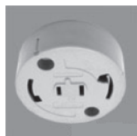
丸型引掛 シーリングボディ