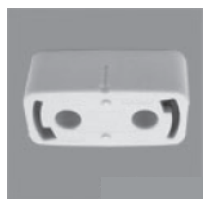
角型引掛 シーリングボディ

下図のようなアダプターが天井に設置されていれば取付が可能です。 アダプターが天井に確実に取り付けられていることをお確かめください。